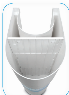
Versione a richiesta con paratia. On request version with partition grid.