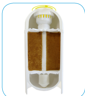
Sistema di distribuzione Plus Drip. Distribution system Plus Drip.