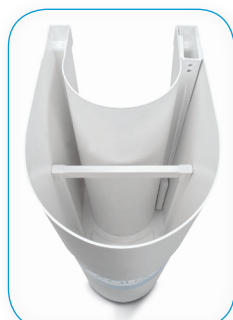
Versione standard. Standard version.